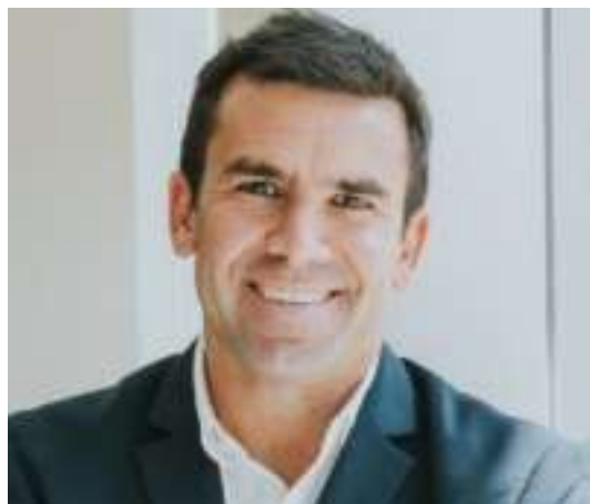
PRESIDENTE Ignacio Del WTC Montevideo Free Zone

DESEM Junior Achievement cuenta con un directorio integrado por representantes de destacadas empresas que a través de su experiencia, conocimiento y compromiso impulsan el mayor potencial de la fundación.